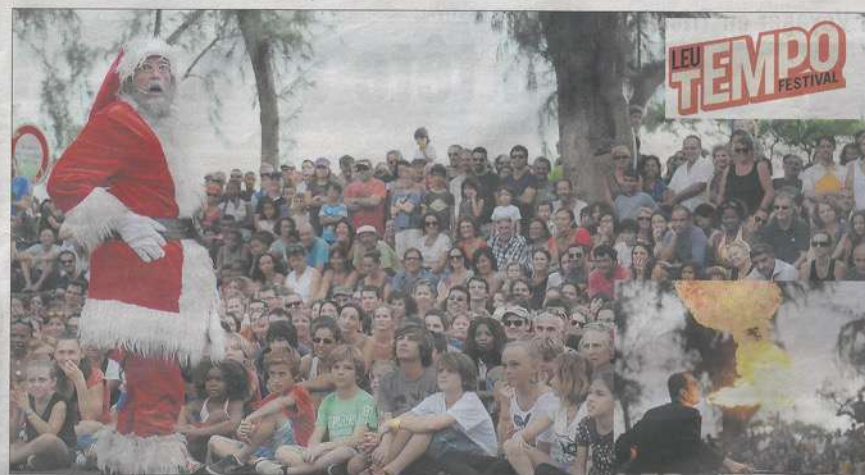
C'est un bon étrange père Noël qui s'invite sur ce seizième numéro du Leu Tempo. Clowns frais en vue.

Le Tony Clifton Circus nous rappelle que la magie n'opère qu'en tant qu'acte gratuit. Les rêves sont beaux parce que désintéressés. ● FRED KAHN